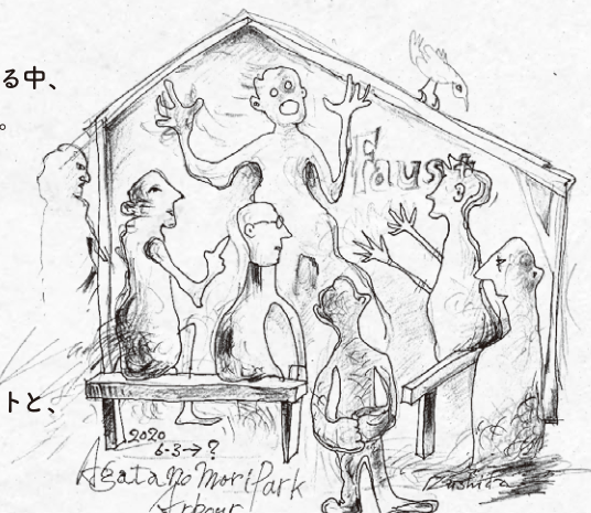
Illustrated by Kazuyoshi Kushida